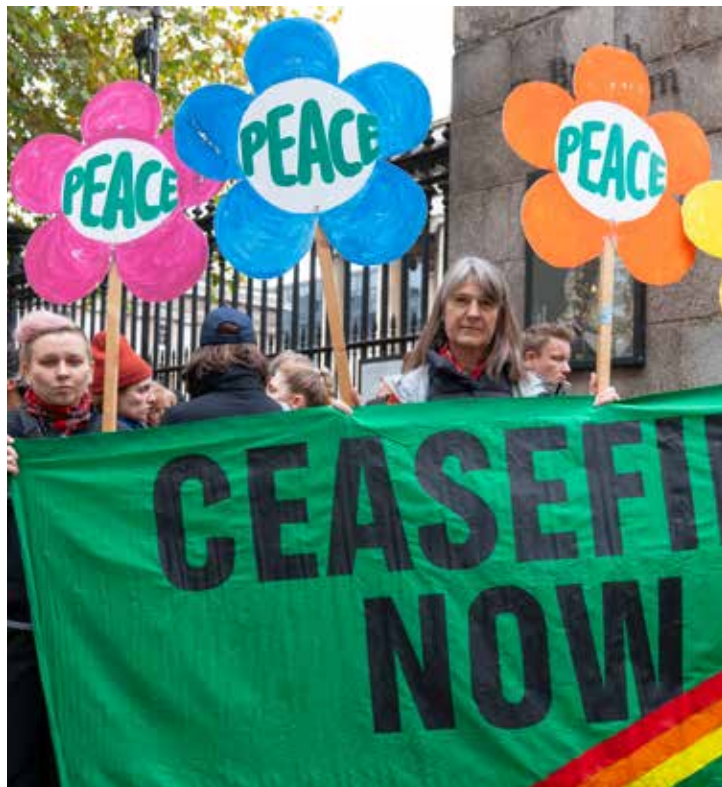
Samling i London för freden, klimatet och rättvisan