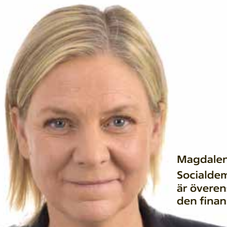
Magdalena Andersson Socialdemokraternas ordförande är överens med regeringen om den finanspolitiska ramen

https://www.aftonbladet.se/nyheter/kolumnister/a/eMq2oQ/cervenka-sverige-paminner-om-en-nojig-prepper