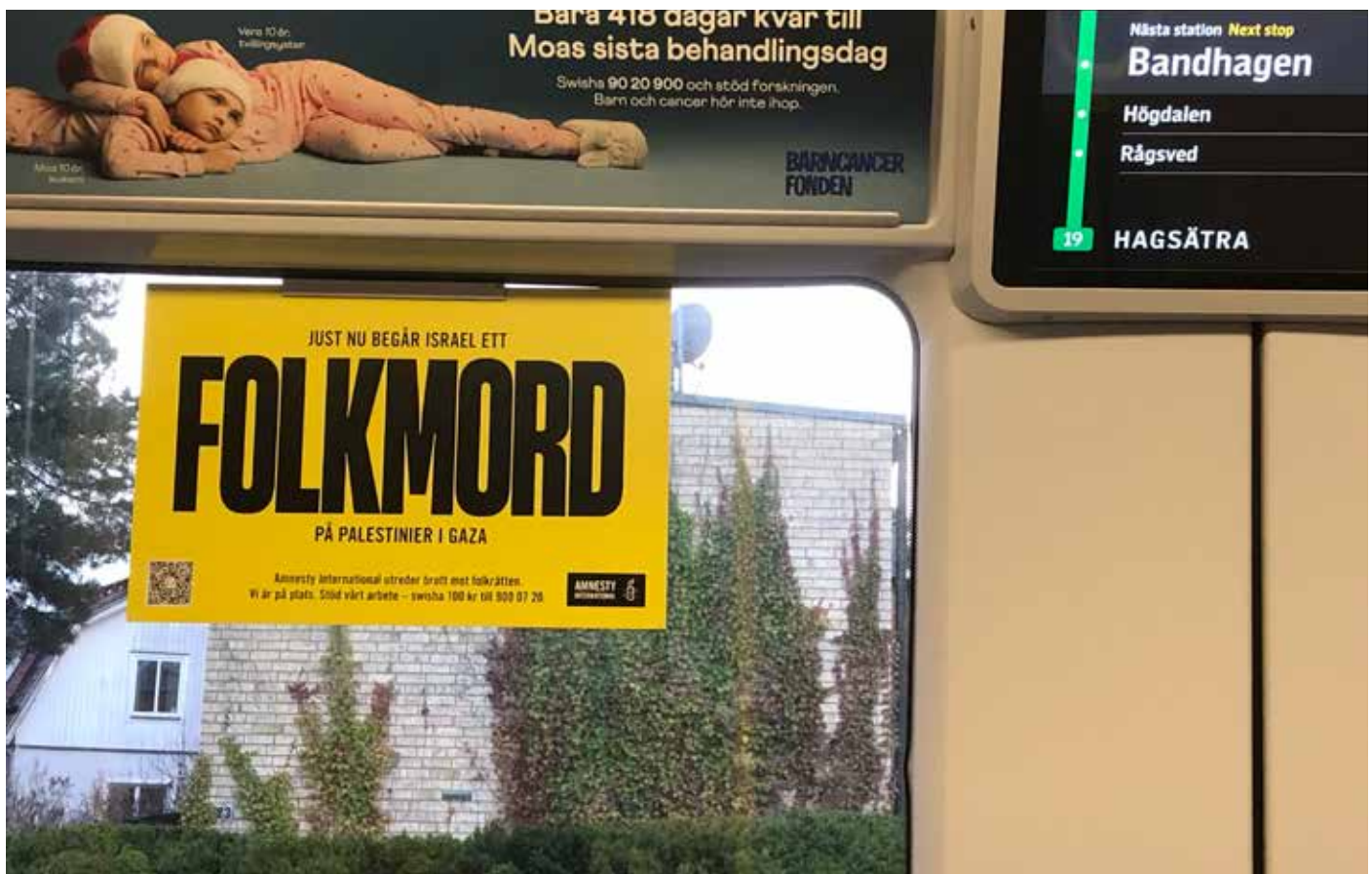
Amnesty International i Stockholms tunnelbana