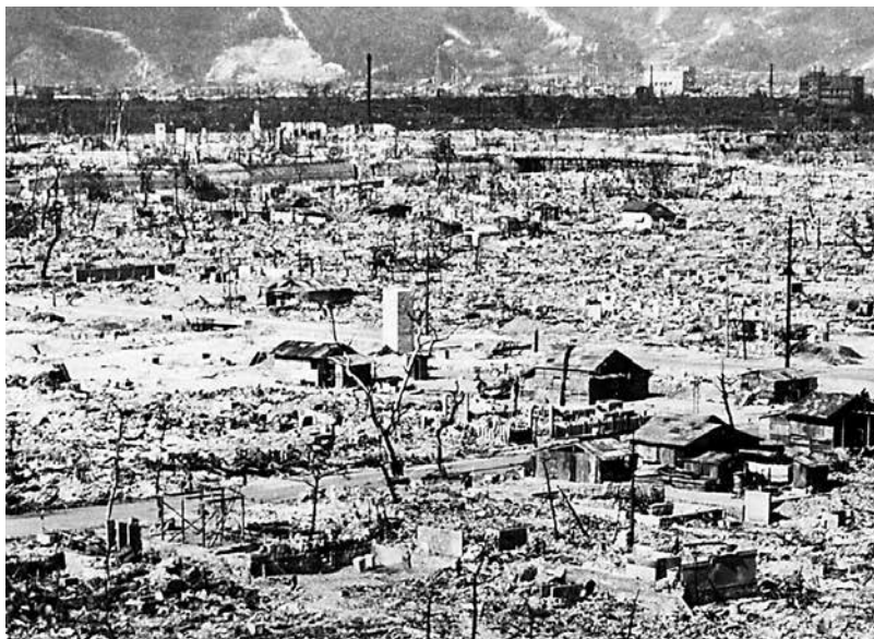
Hiroshima efter bomben