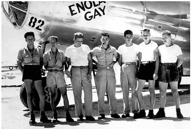
Flygplansbesättningen som utplånade en hel storstad med en enda bomb.

Den 6 augusti 1945 flyger ett amerikanskt bombplan med namnet Enola Gay (efter pilotens mamma) mot den japanska staden Hiroshima. Med sig har det en bomb som kallas Lill-pojken . Det är en ny sorts bomb, med en sprängladdning av uran. USA:s militära och politiska ledning vill gärna testa sin nya bomb innan kriget är slut. Hitlers Tyskland gav upp redan i maj och nu kan japanerna kapitulera när som helst.